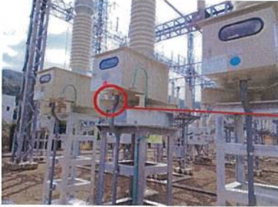
66kV1号BPD外観 (左から白相、赤相、青相)