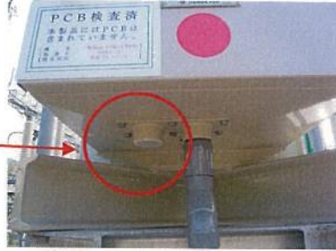
赤相結露防止器なしの状態